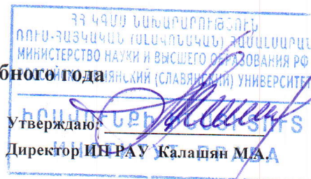
График экзаменационной зимней сессии 2024-2025 учебного года

«ЮРИСПРУДЕНЦИЯ» (магистратура/очная форма обучения)